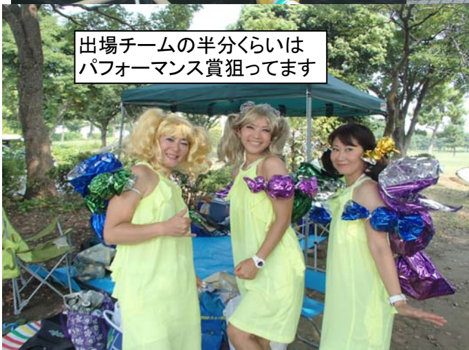
出場チームの半分くらいは パフォーマンス賞狙ってます