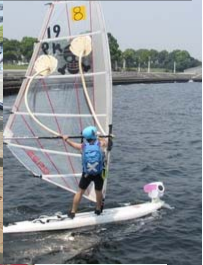
新概念セイル? いや、あれはルフィーの手だ!