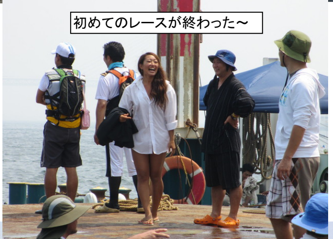
初めてのレースが終わった~