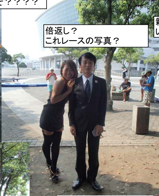
倍返し? これレースの写真?