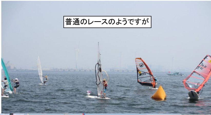
普通のレースのようですが