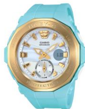
(BGA220G-2AJF) A17、テクノプラス 女性優勝者