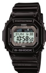
(GLX5600-1JF) U17 男性優勝者