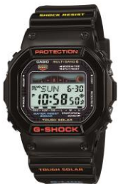
(GWX5600-1JF) A17、テクノプラス 男性優勝者