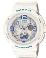
(BGA190-7BJF) U17 女性優勝者